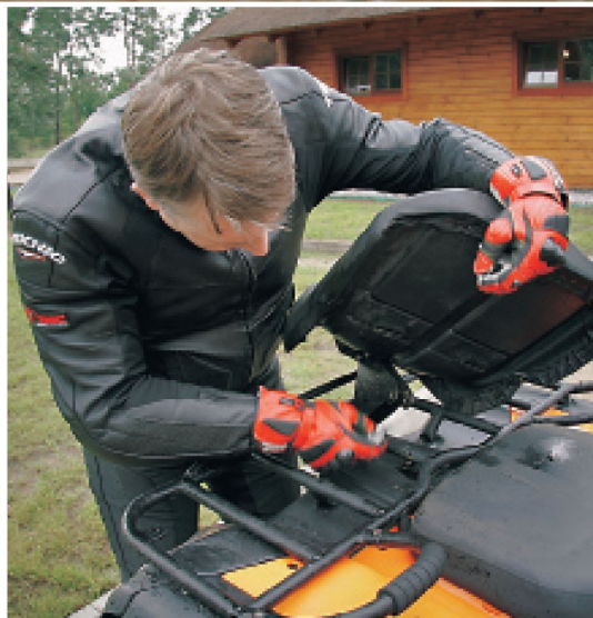
▲ Заднее сиденье съемное, и его достаточно легко демонтировать, открутив четыре болта

Мотозкипировка Текнис и шлем КВС предоставлены компанией «Севен авто»