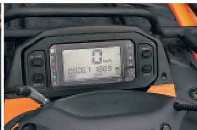
▲ На дисплей выведены все основные показатели, которые легко читаются